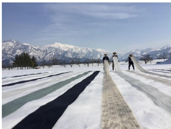
晴天時に上布を雪にさらします