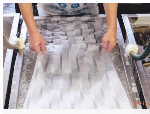
前処理として糊・不純物を除去します